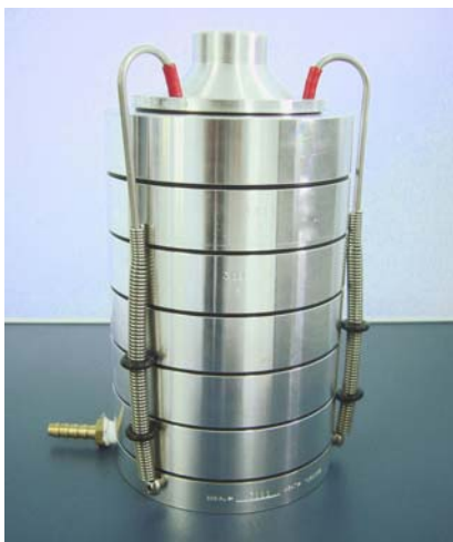
IMPACTADOR DE SEIS ESTÁGIOS